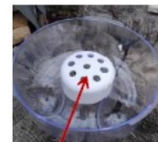
Réducteur diam 9 mm