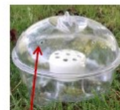
5 Trous de 6 mm Piège à cloche