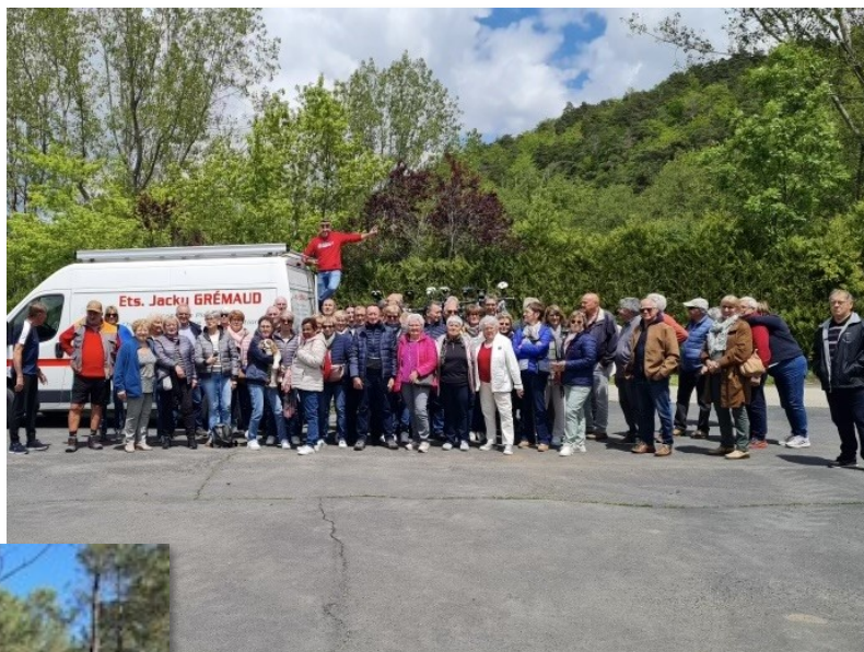
Week-end du club Cyclo et Marche au Lac Chambon Mai 2024

Nous remercions vivement M. le Maire et le Conseil Municipal pour leur soutien et l'aide qu'ils nous apportent lors de nos manifestations.