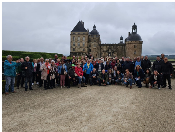
Groupe franco espagnol à l'entrée du château de Hautefort

Le comité de Jumelage est ouvert à tous ceux qui souhaitent y adhérer.