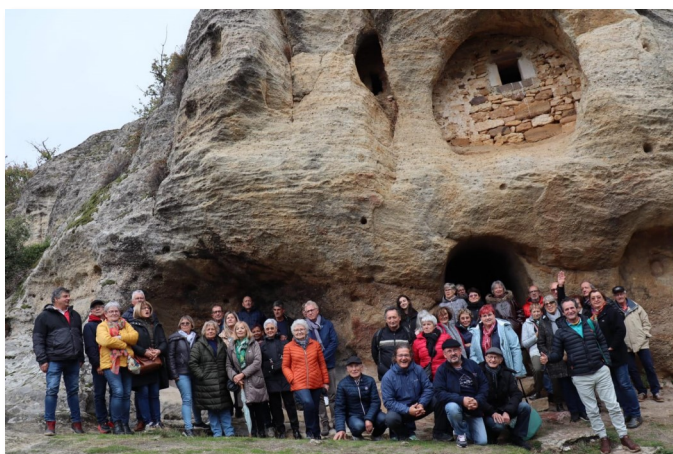
Groupe franco espagnol devant l'Eglise rupestre de Arroyuelos

Saint Crépin d'Auberoche est jumelé avec la commune espagnole de Valderredible située en Cantabrie.