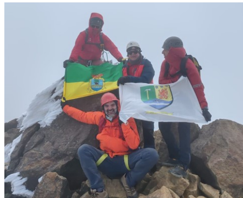
Les blasons de Saint Crépin et de Valderredible hissés sur les sommets du Kilimandjaro et du mont Illiniza en Equateur par nos amis espagnols