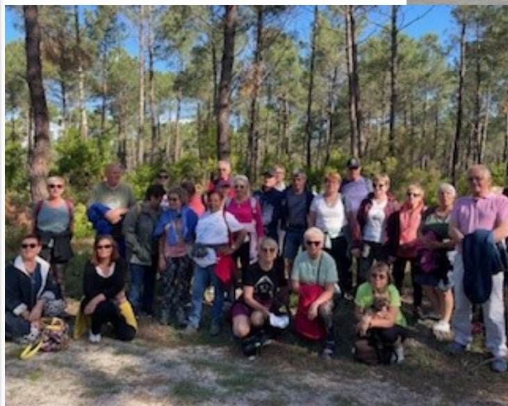
Randonnée à Biscarosse Séjour Mai 2025