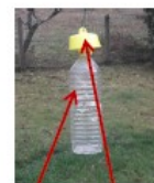
Piège tap trap Bouteille trou 6 mm