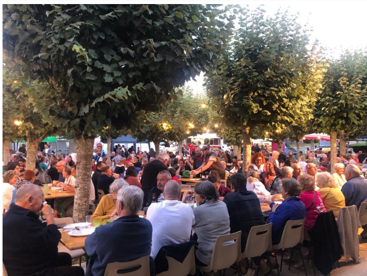
Marché gourmand à Saint Crépin

Connectez-vous sur les réseaux sociaux pour rester informé des activités organisées dans notre belle commune !